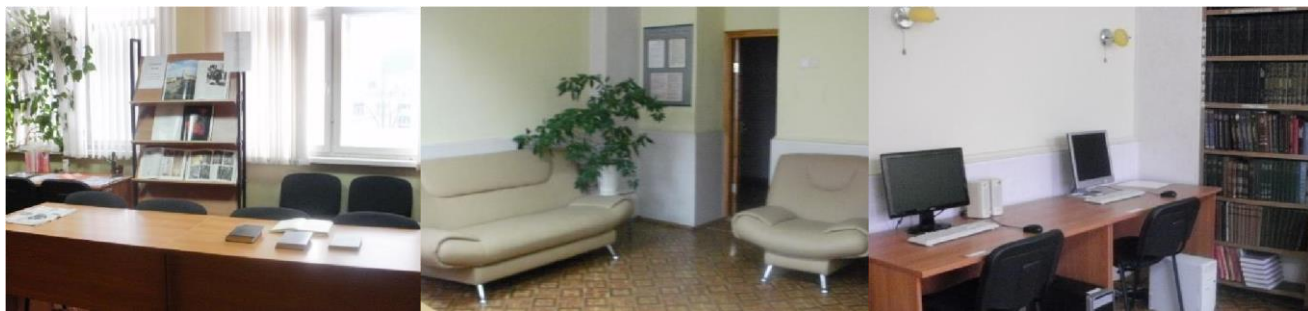
Рисунок 27. Читальный зал библиотеки (пер. Красный,3)