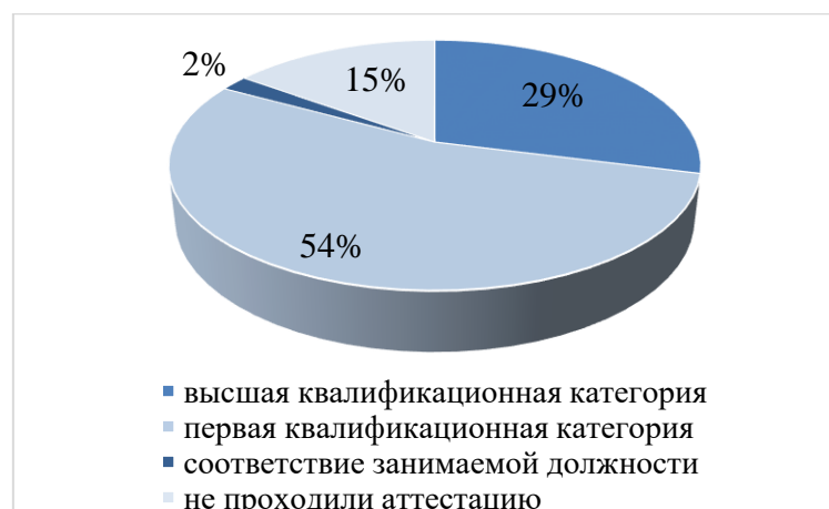
Рисунок 29. Уровень категорийности педагогического коллектива на конец 2018 г.

Уровень категорийности педагогических работников составляет 83%, высшую квалификационную категорию имеют 14 человек (29%), первую – 26 человек (54%), соответствие занимаемой должности – 1 человек (2%). Не проходили процедуру аттестации 7 человек (15%), работающие в техникуме в занимаемой должности менее двух лет.