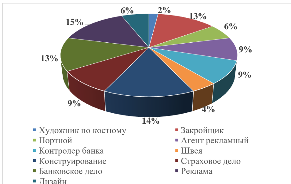
Рисунок 2. Структура контингента

По программам подготовки специалистов среднего звена обучается 445 студентов, что составляет 57% от всего контингента обучающихся в техникуме (в т.ч. обучаются очно 312 человек (40%), заочно 133 человека (17%). По программам подготовки квалифицированных рабочих, служащих обучается 299 студентов (39%), по программе профессиональной подготовки – 29 слушателей (4%).