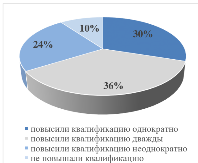
Рисунок 30. Повышение квалификации педагогического коллектива на конец 2018 г.

На конец 2018 года 94% педагогического коллектива (45 человек) прошли обучение по дополнительным профессиональным программам в соответствии с требованиями профессионального стандарта. Не проходили обучение по дополнительным профессиональным программам 3 человека, трудоустроенные с 01.09.2018 г., их обучение запланировано на 2019 год.