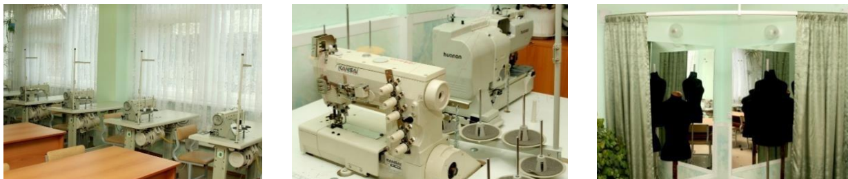
Рисунок 20. Оснащение учебно-производственных мастерских швейного профиля

- швейные учебно-производственные мастерские и лаборатории оснащены современным оборудованием.