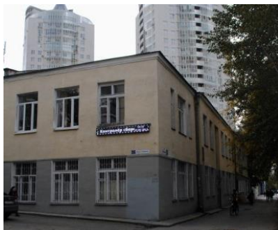
Учебные корпуса пер. Красный, 3