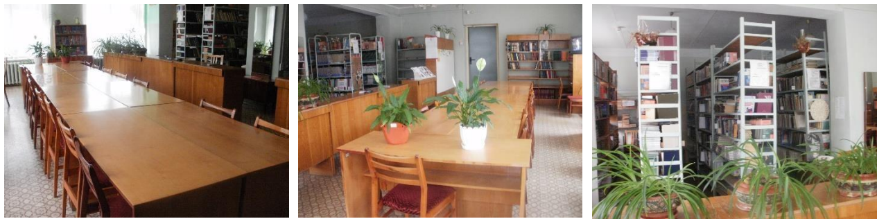
Рисунок 28. Библиотека (ул. Стахановская, 43)

Библиотеки техникума обеспечивают учебно-воспитательный процесс техникума учебной, научной, справочной и художественной литературой, периодическими изданиями и информационными материалами, а также реализует права читателя: