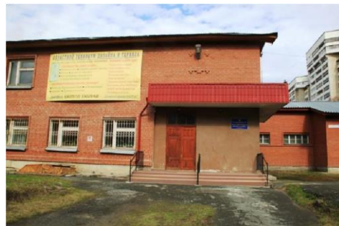
Учебный корпус ул. Стахановская, 43

Общая площадь корпусов 8734 кв.м. Площадь помещений, в которых осуществляется образовательная деятельность 2987 кв.м., в расчете на одного обучающегося – 4,09 кв.м. Имущественный комплекс используется в соответствии с уставной деятельностью. В аренду сдается 288 кв.м помещений столовой. Неиспользуемое недвижимое имущество отсутствует.