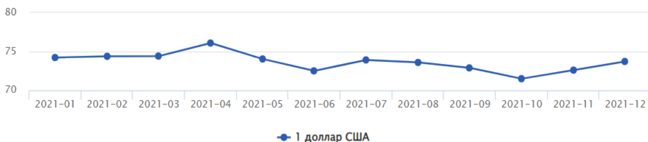
Рисунок 2. График изменения курса доллара США за 2021 год